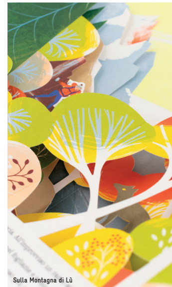
Sulla Montagna di Lù