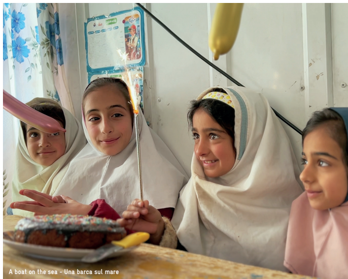
A boat on the sea - Una barca sul mare