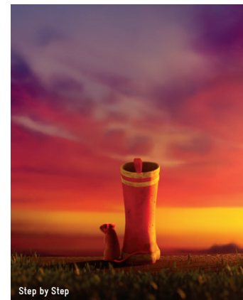
Step by Step